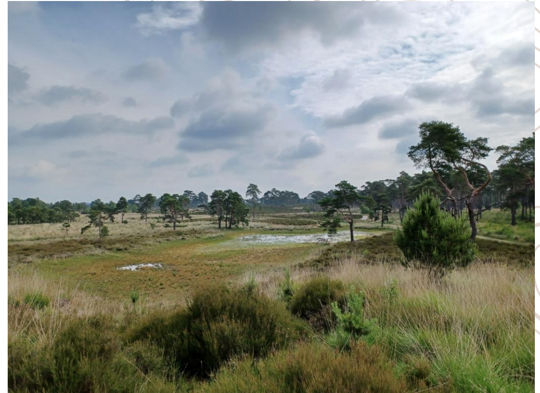
Natuur in het gebied Brabantse Wal.