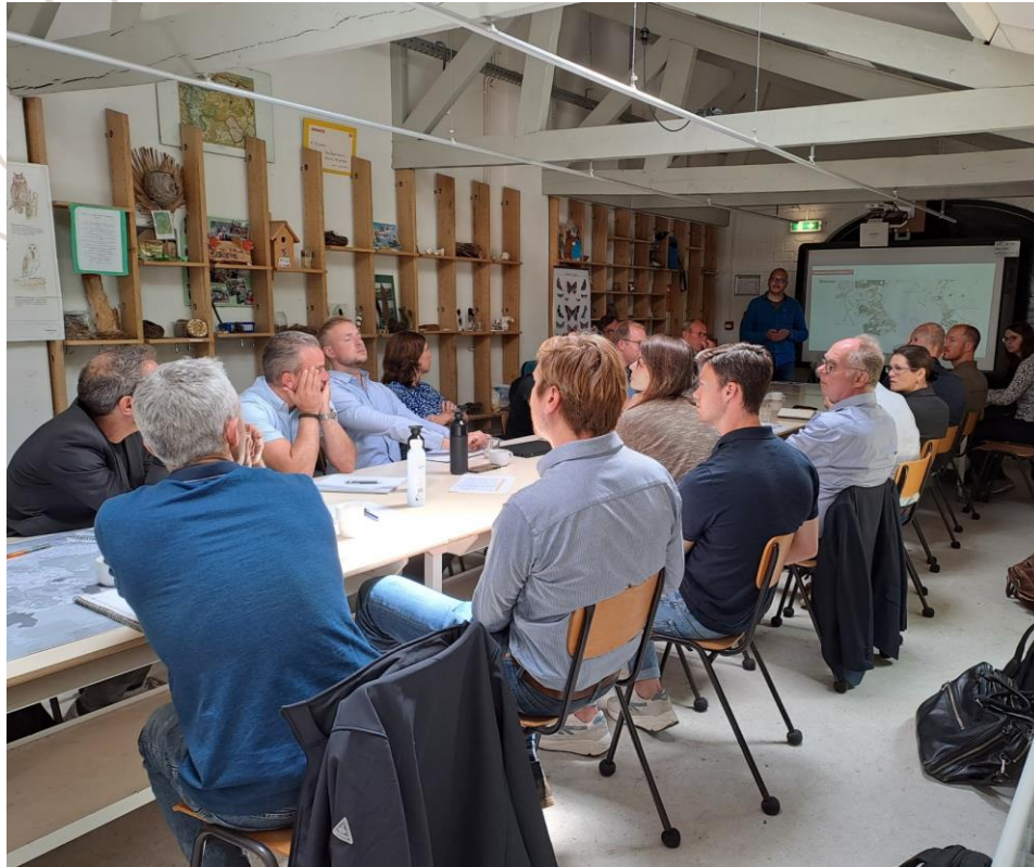
Gebiedspartners tijdens de themasessies.