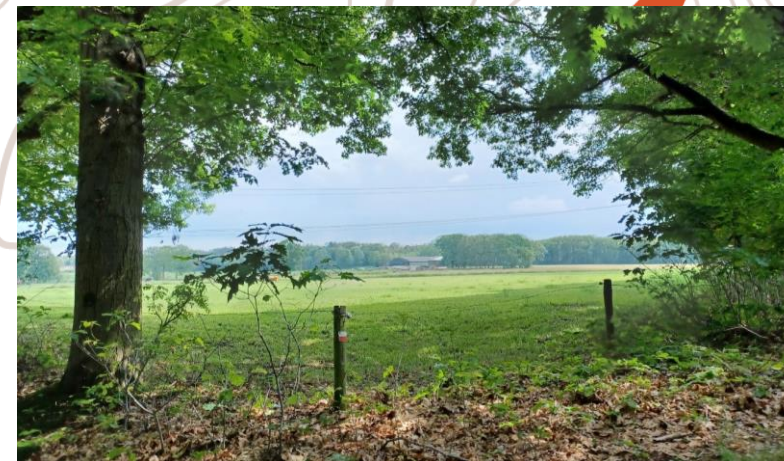
De Brabantse Wal kenmerkt zich o.a. door landerijen die tussen bossen liggen.