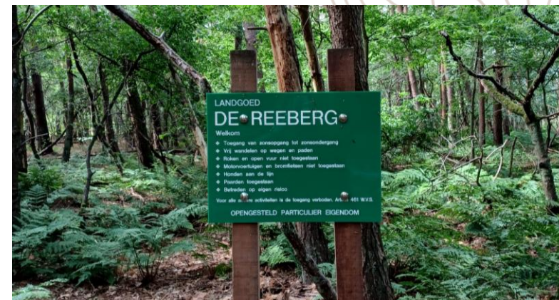
Het gebied is van oudsher erg divers en er komen relatief veel landgoederen voor op de Brabantse Wal.

“De Brabantse Wal kent een rijke historie als landschap in transitie”