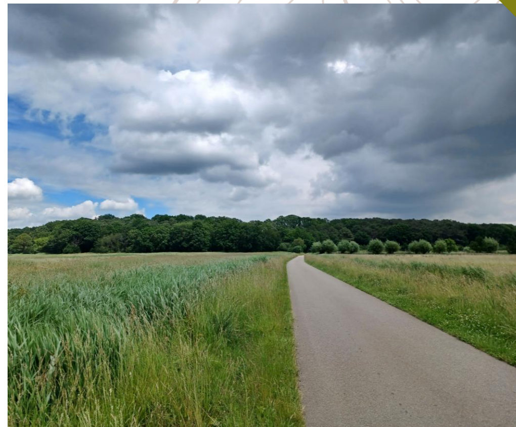
Zicht op de Wal