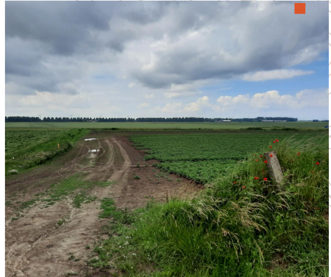
Akkerbouwvelden aan de voet van de Brabantse Wal.