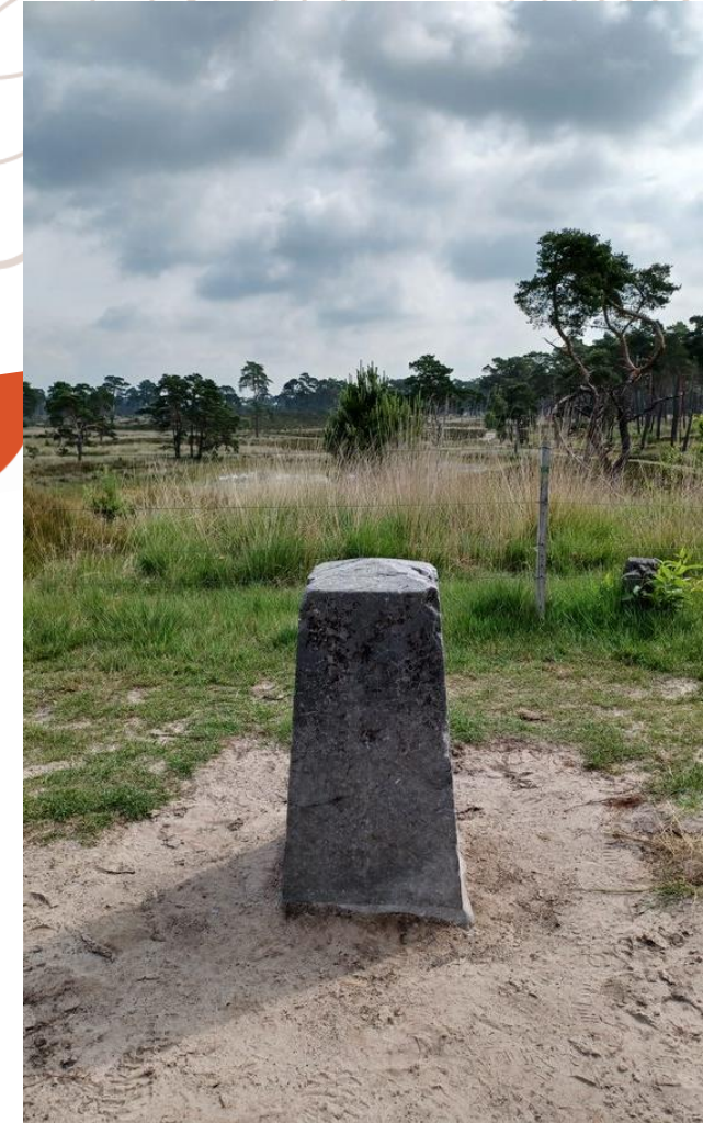
Grenspaal op de Kalmthoutse Heide.