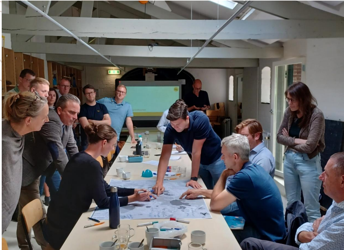
Gebiedspartners tijdens de themasessies.

"Laten we de energie vasthouden en samen integraal aan de slag gaan"